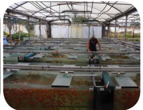
Pour le marché de l'aquariophilie : des élevages concentrationnaires.