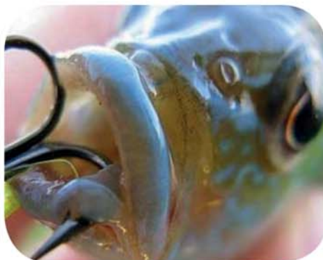
La «pêche de loisir» : une horreur pour les victimes.