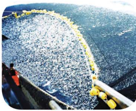
La pêche à la senne tournante : une razzia meurtrière.