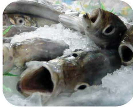
Ils agonisent parfois de longues heures sur la glace dans les navires-usines.