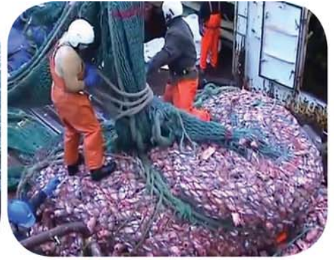
La pêche au chalut : un massacre sans précédent, des morts terribles.