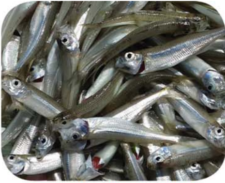
Nous tuons des milliers de milliards de poissons et autres animaux aquatiques.