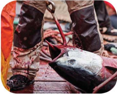
Les pires cruautés sont légales et banales concernant les poissons.