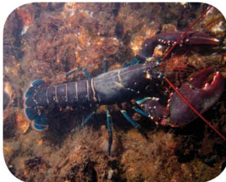
Les crustacés aussi souffrent et souhaitent vivre.