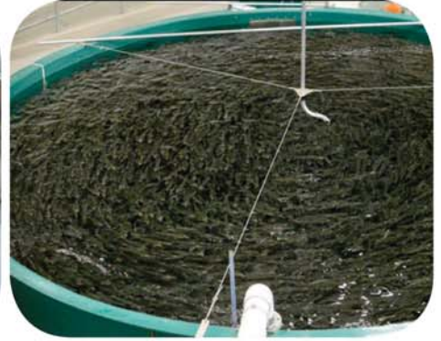
Certains élevages concentrationnaires: des citernes .