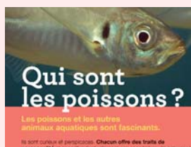
Les poissons et les autres animaux aquatiques sont fascinants. Ils sont souvent et personnellement. Chacun offre des traits de personnalité et connaît individuellement ses congénères. Ils ont une vie...

Le lauréat sera sélectionné par un comité scientifique composé d'un représentant de l'association Run4science, d'un collègue d'experts dans le domaine des méthodes substitutives (parmi lesquels notre consultant le Dr. Massimo Tettamanti) ainsi que de représentants des associations ayant contribué financièrement.