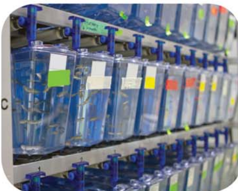
Les poissons sont aussi des victimes de l'expérimentation animale .