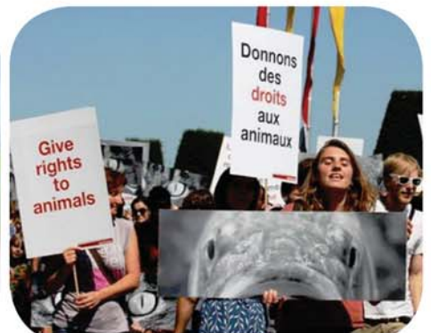
Manifestons pour donner des droits aux poissons!