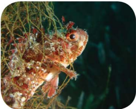
Les déchets de filets continuent de piéger les poissons pendant des années.